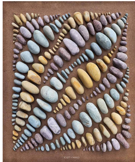
Un tapis de galets