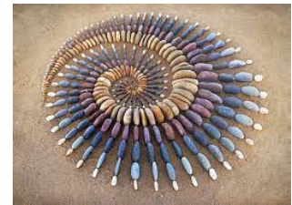
Un escargot des sables