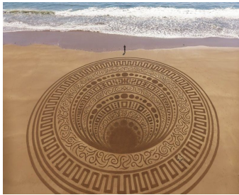
Un mandala en trompe l'oeil sur le sable

Allez, suivez le guide et laissez-vous emporter par la poésie de ces images ; souvenirs d'œuvres fugaces !